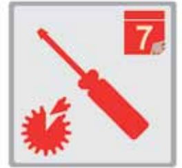
Wartung, Reparatur, Instandhaltung